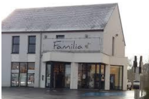
Le petit dernier, la pharmacie Familia de Vance